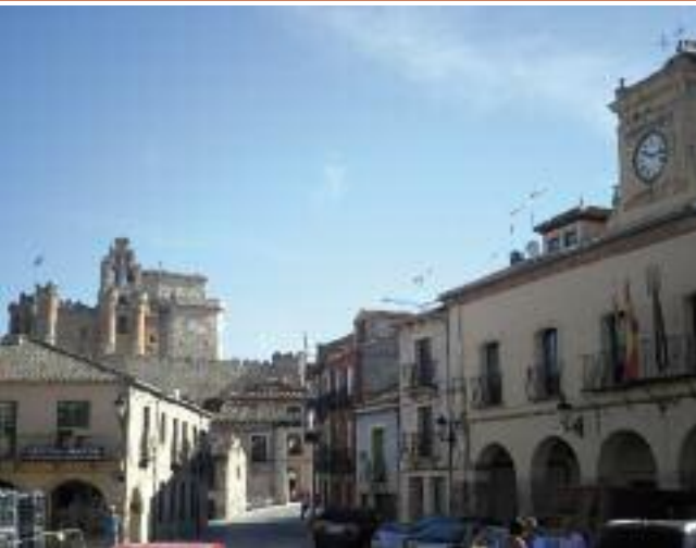
Castillo de Turégano desde la Plaza

El recorrido transcurre en su inicio por un bosque de pinos, para adentrarnos en un bosque de enebros. Las cuencas fluviales que nos encontramos son el Cega (km 4), el río Viejo (km 33.75) río Pirón (km 37.25) y el río Cigueñuela (km 57) y el río Eresma (km 59) ya en Segovia. Pedaleo por los campos castellanos y por el piedemonte segoviano, encinares y sabinars, por valles pronunciados que pueden hacernos apretar los dientes.