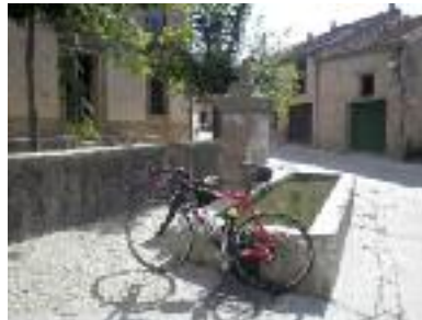
Pilón de El Guijar