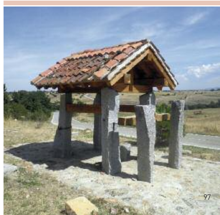
Petro de herrar

En Brieva , iglesia de Santiago Apóstol y fragua. Torrecaballeros posee un buen número de ranchos dedicados al esquileo por ser paso obligado de la Cañada Soriano Occidental o también conocida como Vera de la Sierra; iglesia de San Nicolás de Bari con elementos románicos y retablo de estilo barroco churrigueresco.