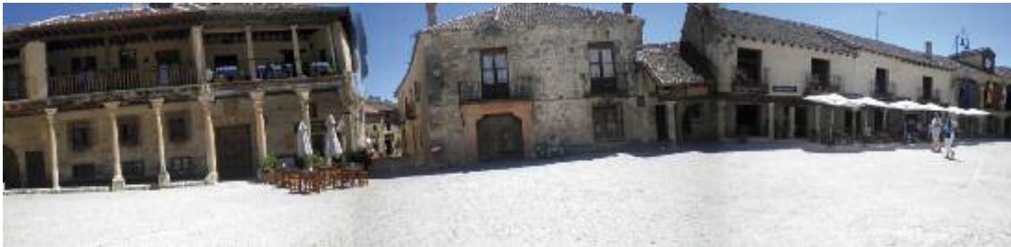
Plaza de Pedraza