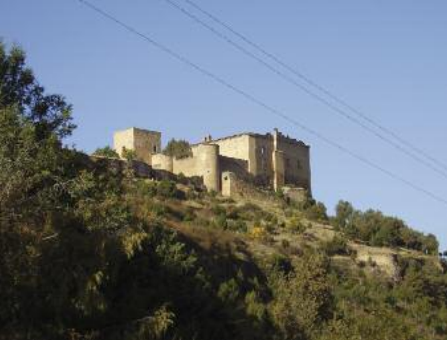
Castillo de Pedraza