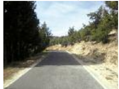
Bosque de enebros