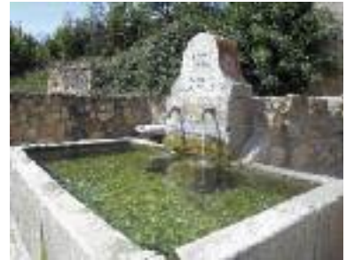
Pilón de Adrada de Pirón

El recorrido transcurre en su inicio por un bosque de pinos, para adentrarnos en un bosque de enebros. Las cuencas fluviales que nos encontramos son el Cega (km 4), el río Viejo (km 33.75) río Pirón (km 37.25) y el río Cigueñuela (km 57) y el río Eresma (km 59) ya en Segovia. Pedaleo por los campos castellanos y por el piedemonte segoviano, encinares y sabinars, por valles pronunciados que pueden hacernos apretar los dientes.