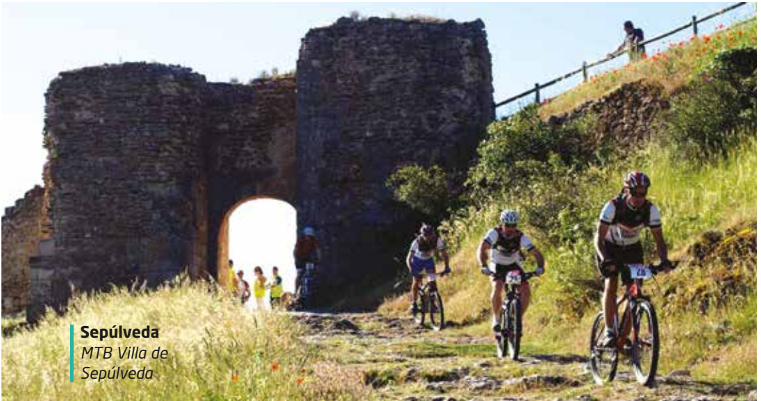
Sepúlveda MTB Villa de Sepúlveda