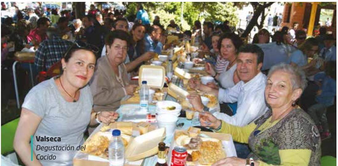
Valseca Degustación del Cocido