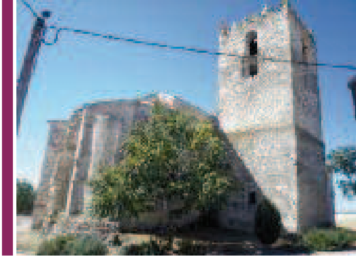
Iglesia de Fuentes de Cuéllar en honor a San Juan Bautista