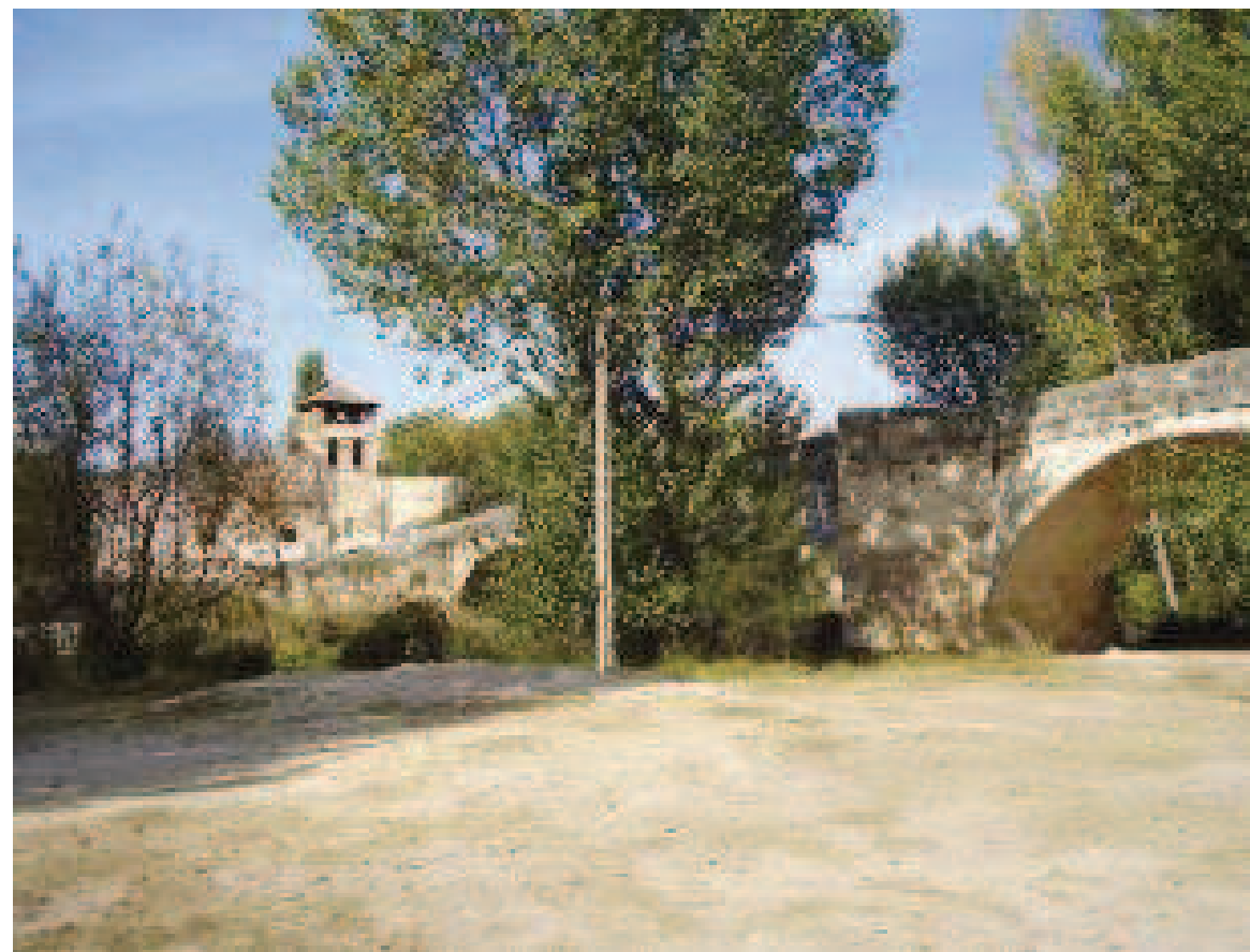
Puente medieval en Fuentidueña