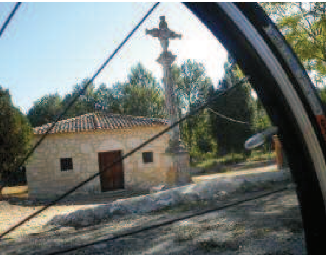
Ermita de Nuestra Señora del Prado, en Pecharromán

nasterio de Santa María la Real, también conocido como abadía cisterciense de San Bernardo. Las bodegas se han convertido en merenderos. Destaca la localidad por su cordero asado.