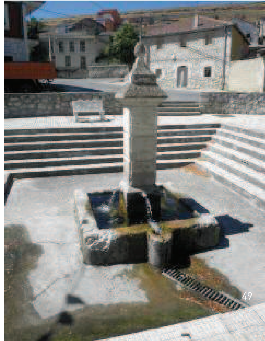
Fuente de Aldeasoña

Antes de entrar en Aldeasoña , tres cruces que finalizan el vía crucis; iglesia de la Magdalena de estilo gótico con elementos románicos y casa blasonada; batán. En Laguna de Contreras , templo barroco de Nuestra Señora de la Asunción, puente romano en la vega del río Duratón, palomares y palacio de los Condes de Contreras.