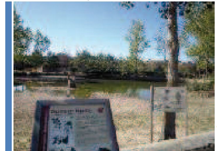
Nava o charca en Tejares