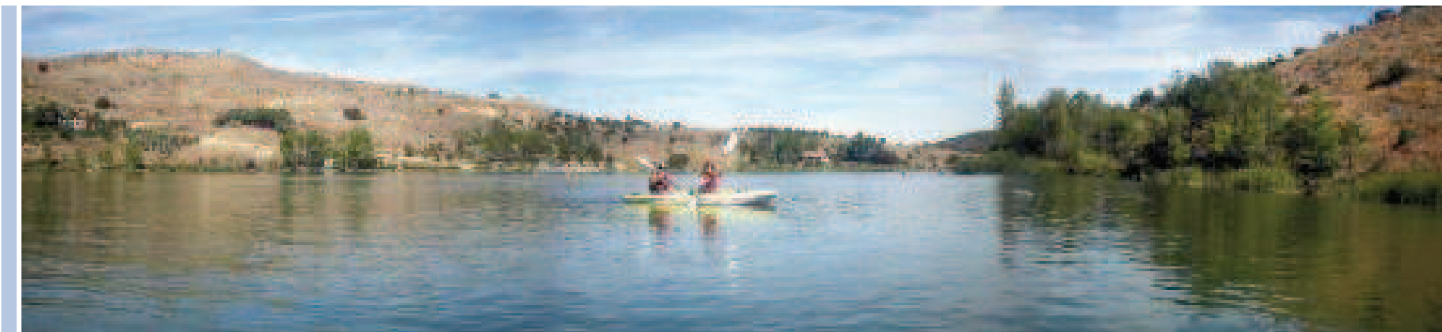
Pantano de las Vencías

Destacamos por su singularidad, el rollo o picota, que todavía se conserva en Navares de las Cuevas ; una columna de piedra que representaba la categoría administrativa en la época medieval, y que junto con la picota, se utilizaba para realizar ajusticiamientos públicos. De igual modo, la localidad de Castrojimeno posee una variedad inusitada de fósiles marinos, por lo general invertebrados como moluscos o corales; se sitúa en lo que fuera una barrera de arrecifes marinos.