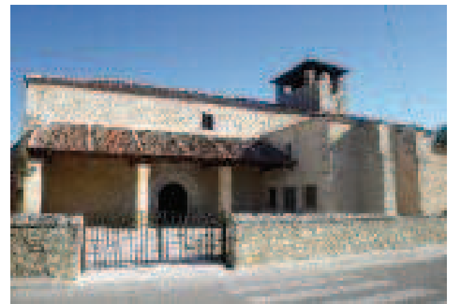
Ermita románica en Fuentidueña