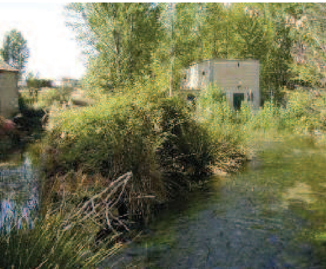
Manantiales del Salinero