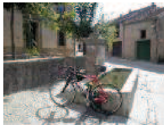
Pilón de El Guijar