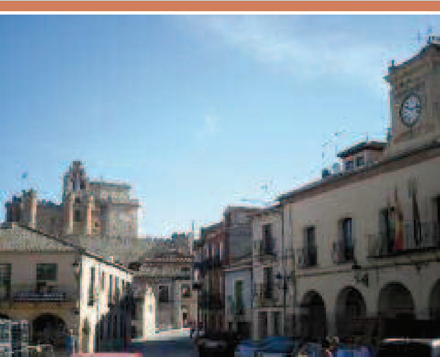
Castillo de Turégano desde la Plaza

El recorrido transcurre en su inicio por un bosque de pinos, para adentrarnos en un bosque de enebros. Las cuencas fluviales que nos encontramos son el Cega (km 4), el río Viejo (km 33.75) río Pirón (km 37.25) y el río Cigueñuela (km 57) y el río Eresma (km 59) ya en Segovia. Pedaleo por los campos castellanos y por el piedemonte segoviano, encinares y sabinares, por valles pronunciados que pueden hacernos apretar los dientes.