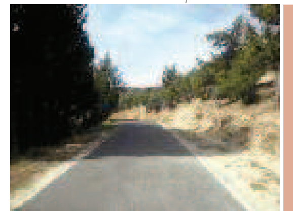
Bosque de enebros