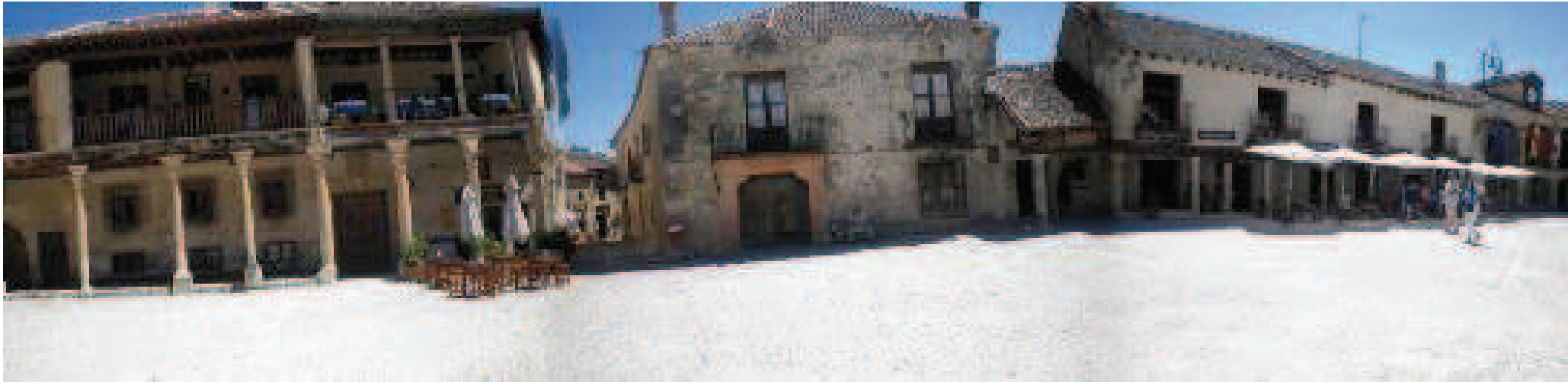
Plaza de Pedraza