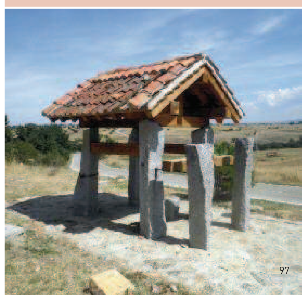
Potro de herrar

En Brieva , iglesia de Santiago Apóstol y fragua. Torrecaballeros posee un buen número de ranchos dedicados al esquileo por ser paso obligado de la Cañada Soriano Occidental o también conocida como Vera de la Sierra; iglesia de San Nicolás de Bari con elementos románicos y retablo de estilo barroco churrigueresco.