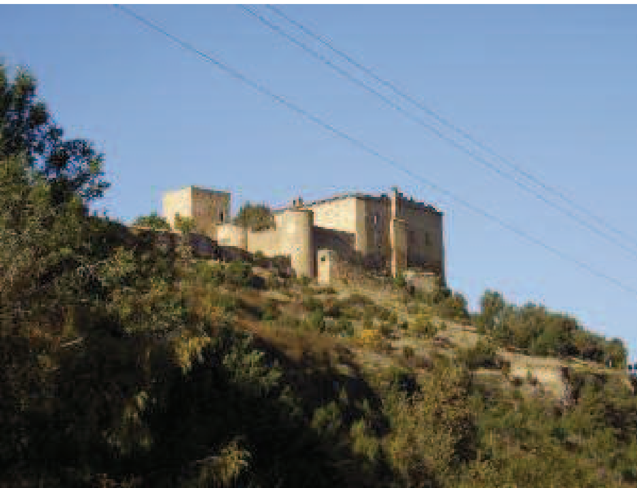
Castillo de Pedraza