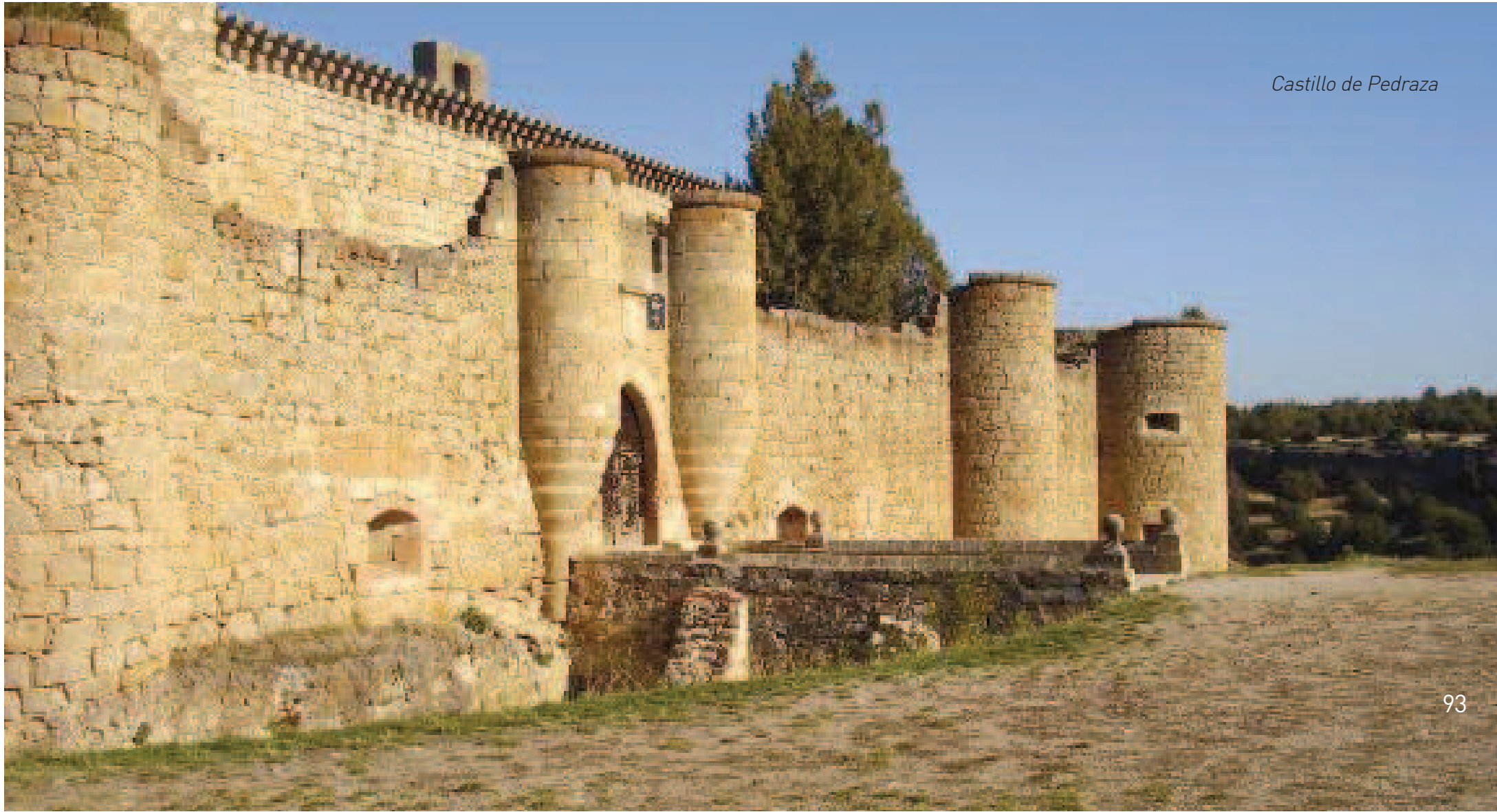
Castillo de Pedraza