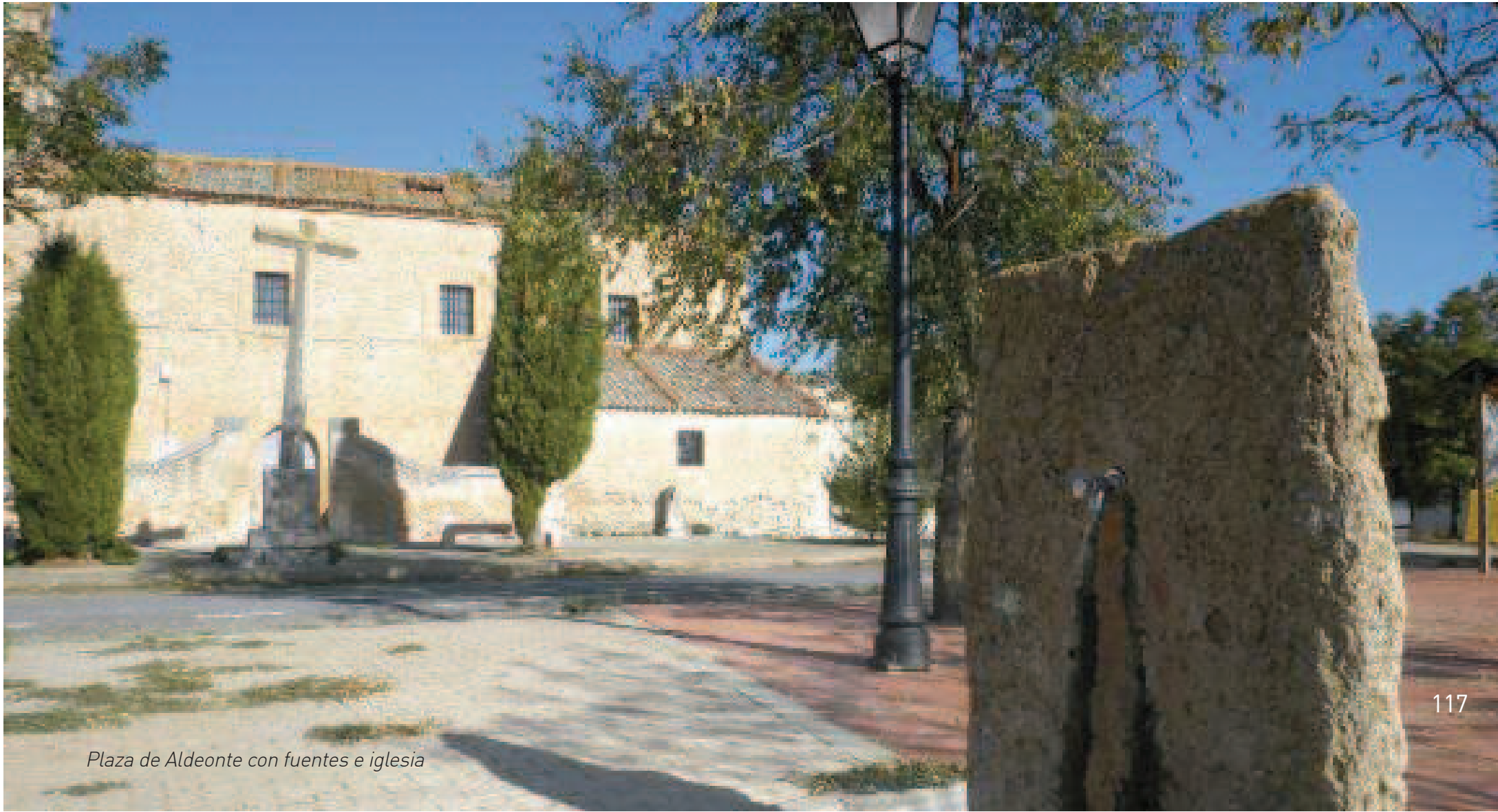
Plaza de Aldeonte con fuentes e iglesia