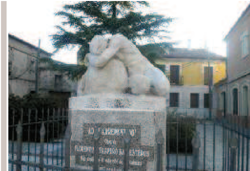
"Adán arrepenido" en Aguilafuente

En Aldeonte , iglesia de San Frutos Pajarero y en honor a su nombre, pues significa adea de agua, posee junto a la iglesia tres fuentes, en el camino a Boceguillas fuente de la Capalana; para salir de Aldeonte, giro a la izquierda, dirección Boceguillas.