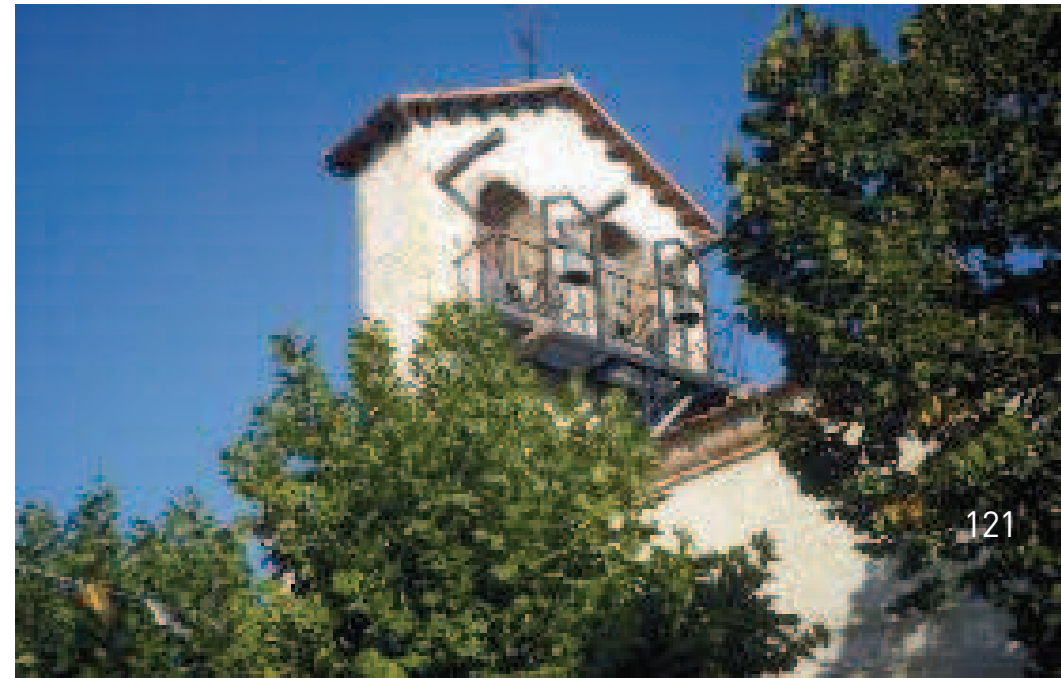
Campanario de la iglesia de Sebúlcór

En BOCEGUILLAS , casa blasonada del Cardenal Cisneros y templo en honor a Nuestra Señora del Rosario.