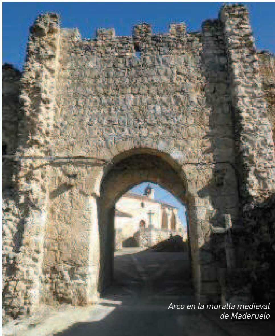
Arco en la muralla medieval de Maderuelo