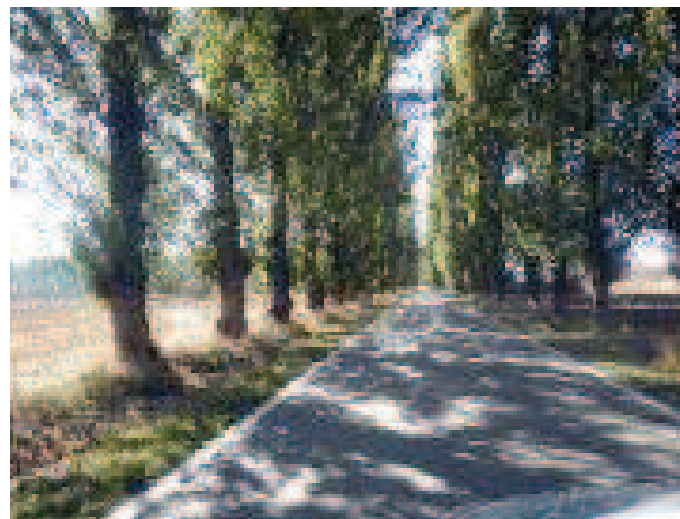
Carretera a Alconadilla

MADERUELO es un conjunto histórico, una villa propia del medievo. Encontramos otros elementos de época romana como es el puente romano y ermitas de origen románico: ermita de la Vera Cruz, ermita de Nuestra Señora de Castroboda, iglesia de San Miguel, reclusa del pantano de Linares y antiguo castillo con la existencia de torreón y arco de acceso a la zona amurallada.