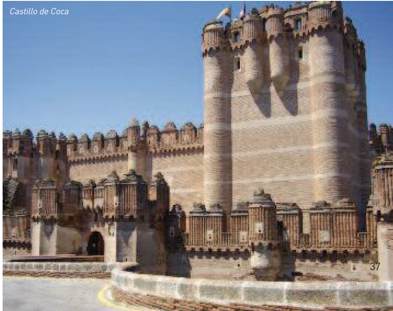
Castillo de Coca