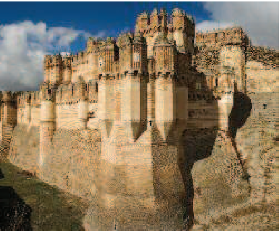
Castillo de Coca