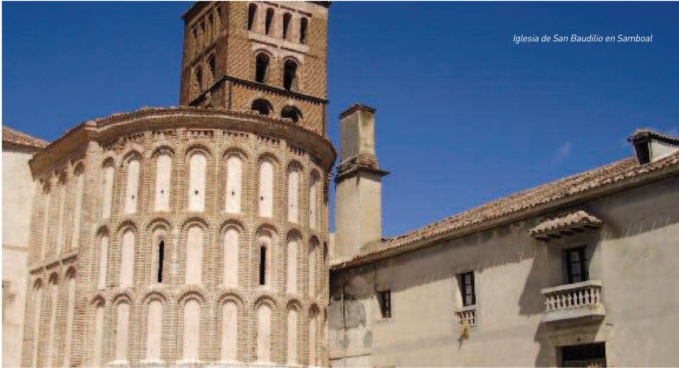
Iglesia de San Baudilio en Samboal