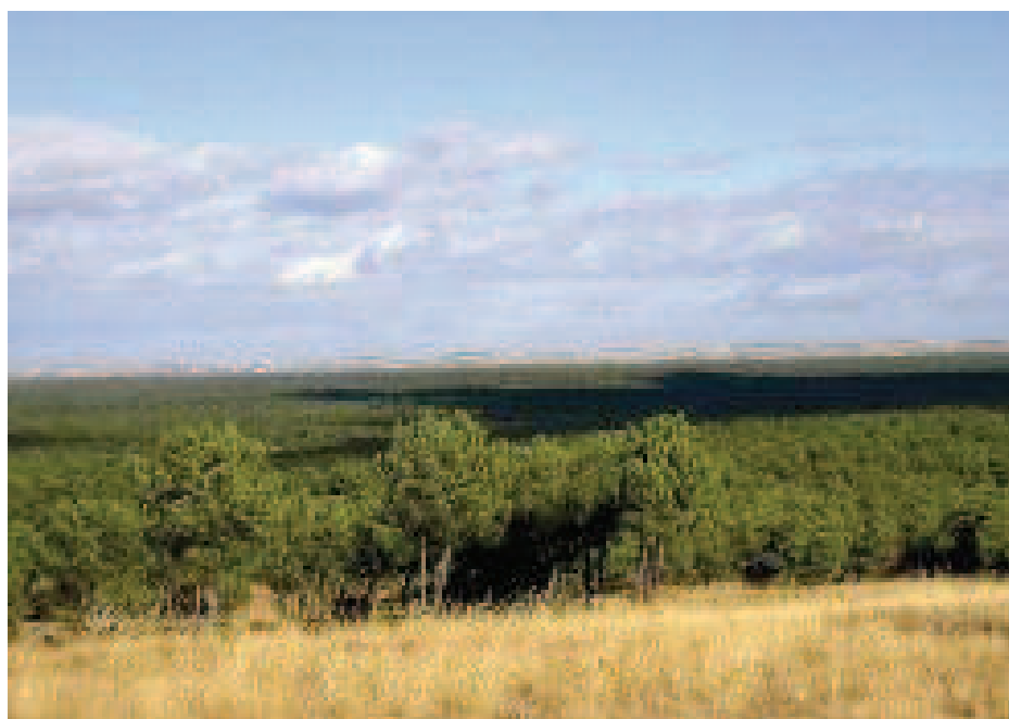
Mar de pinares

El elemento más destacado es el pino resinero que junto al pino piñonero dan nombre a la gran extensión de la Tierra de Pinares que caracteriza el recorrido. Con el aprovechamiento de la resina para aguarrás y otros productos, esta zona segoviana fue muy próspera hasta mediados de siglo XX, a partir de entonces, los productos fueron sustituidos por derivados del petróleo.