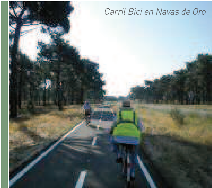
Carril Bici en Navas de Oro

En CUÉLLAR , Centro del Arte Mudéjar; muralla medieval; edificios medievales en los que destacan la casa del Duque de Albuquerque y el palacio de Pedro I; capilla y hospital de la Magdalena; castillo de los Duques de Albuquerque; panera y granero; iglesias, conventos y palacios; destaca por tener los encierros más antiguos de España, declarados de Interés Turístico Nacional.