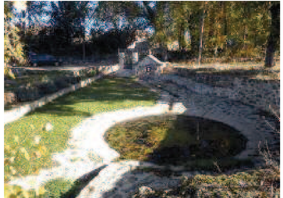
Fuente de Villafranca

Cerezo de Abajo es un pueblo marcado por el paso de la Nacional I y tiene una iglesia que fue trasladada desde Mansilla, en honor a