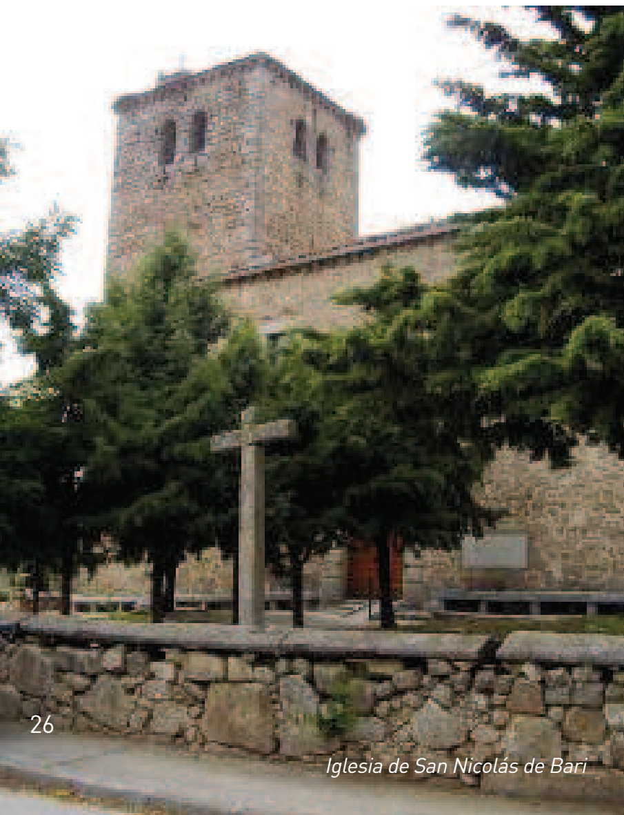
Iglesia de San Nicolás de Bari