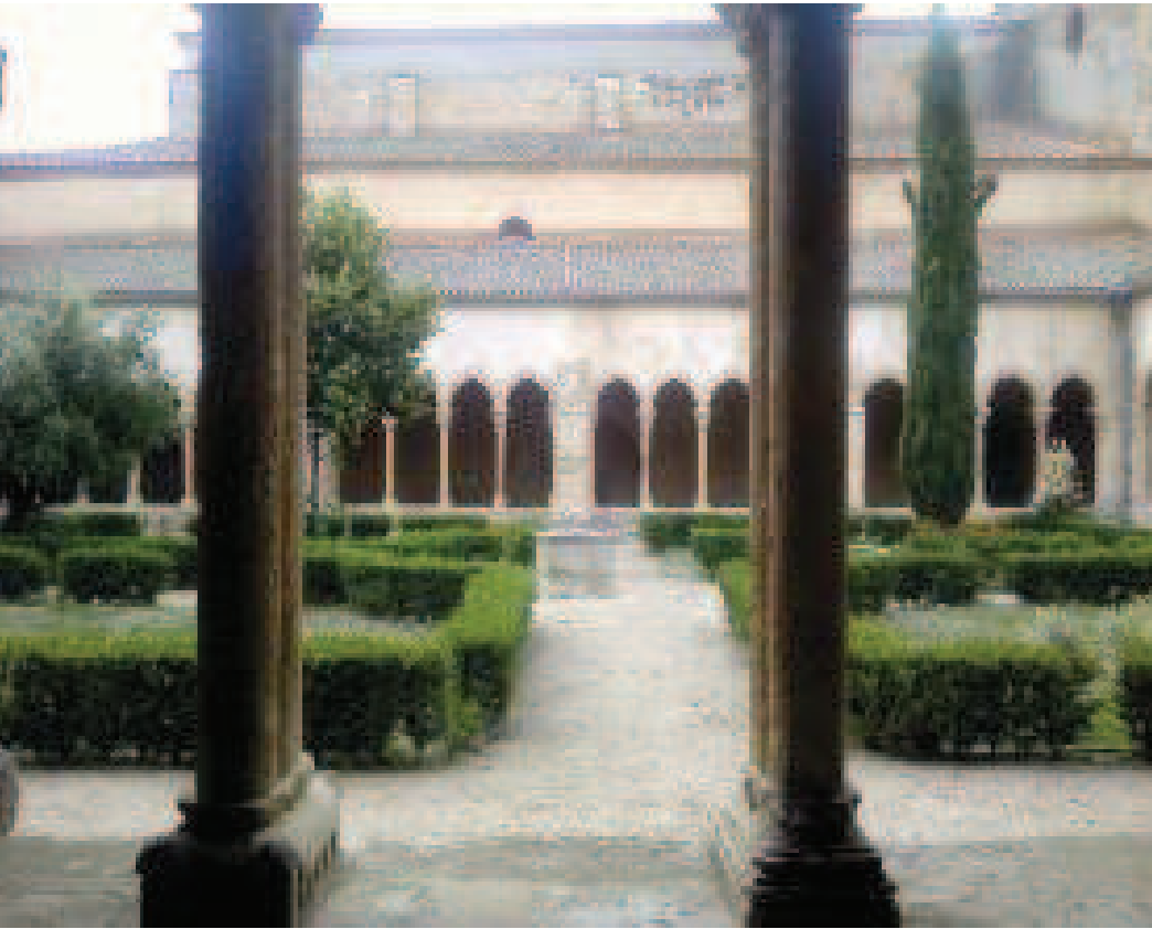
Claustro del Monasterio de Santo Domingo en Santa María La Real de Nieva