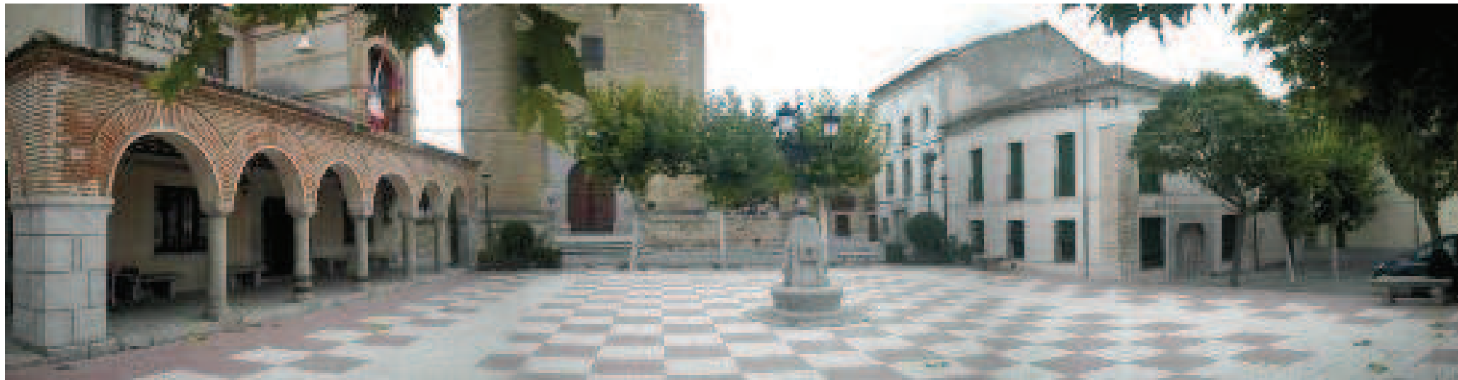
Plaza de Sangarcía

En Santa María la Real de Nieva , iglesia de Nuestra Señora de La Soterraña, plaza de toros y claustro del monasterio de Santo Domingo; en Nieva , iglesia de San Esteban y monasterio.