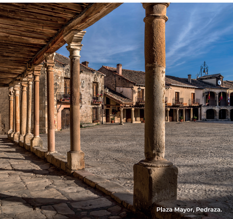
Plaza Mayor, Pedraza.