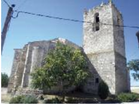
Fuente de Aldeasoña