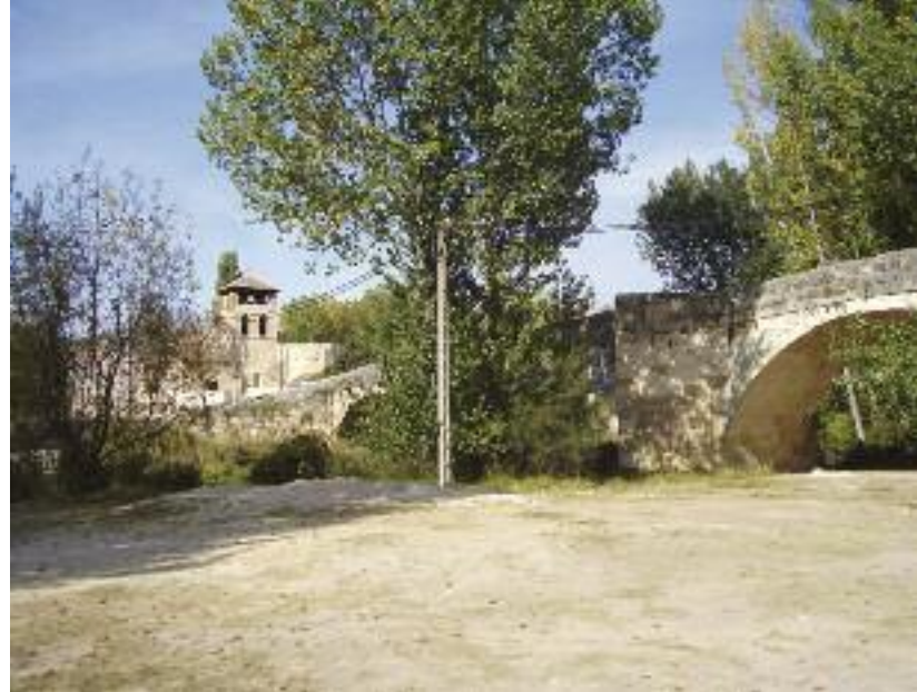
Puente medieval en Fuentidueña