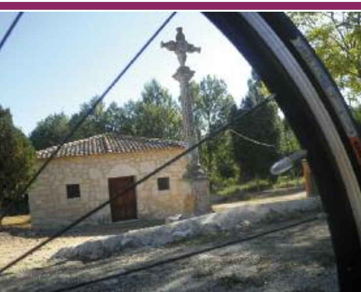
Ermita de Nuestra Señora del Prado, en Pecharromán

nasterio de Santa María la Real, también conocido como abadía cisterciense de San Bernardo. Las bodegas se han convertido en merenderos. Destaca la localidad por su cordero asado.