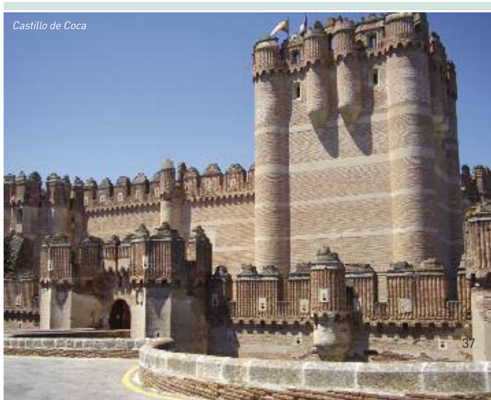
Castillo de Coca