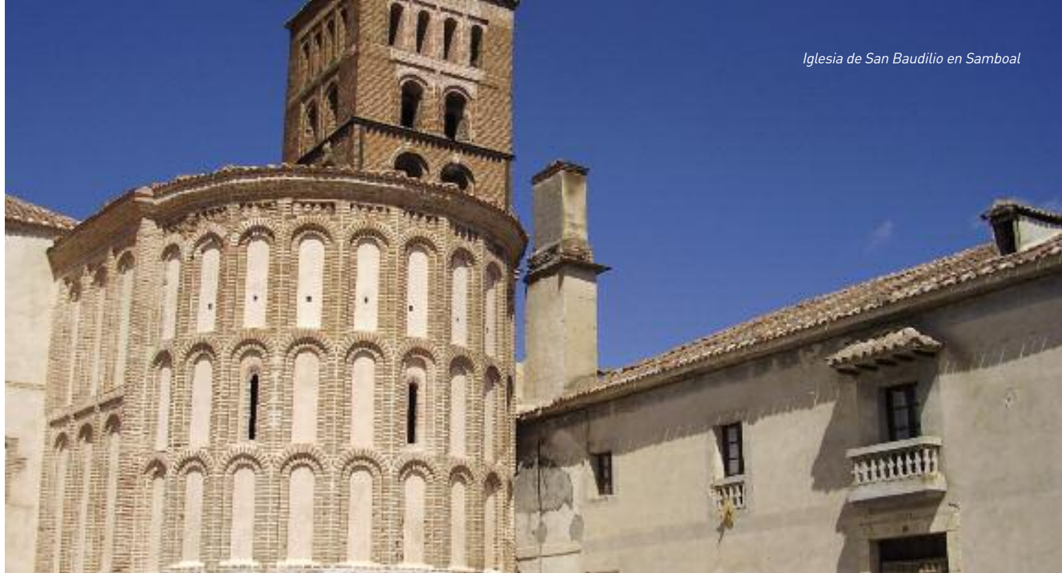
Iglesia de San Baudilio en Samboal