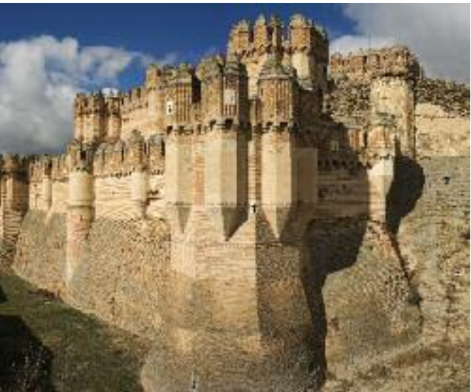
Castillo de Coca