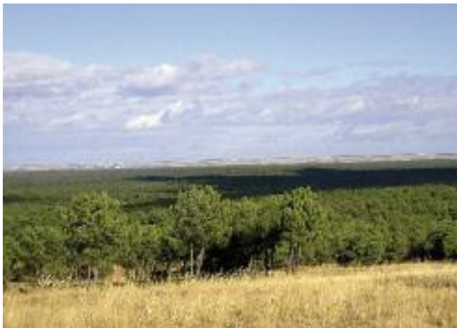
Mar de pinas

El elemento más destacado es el pino resinero que junto al pino piñonero dan nombre a la gran extensión de la Tierra de Pinares que caracteriza el recorrido. Con el aprovechamiento de la resina para aguarrás y otros productos, esta zona segoviana fue muy próspera hasta mediados de siglo XX, a partir de entonces, los productos fueron sustituidos por derivados del petróleo.