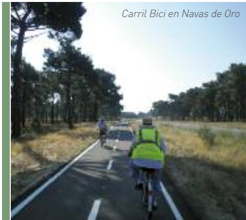
Carril Bici en Navas de Oro

En CUÉLLAR , Centro del Arte Mudéjar; muralla medieval; edificios medievales en los que destacan la casa del Duque de Alburquerque y el palacio de Pedro I; capilla y hospital de la Magdalena; castillo de los Duques de Alburquerque; panera y granero; iglesias, conventos y palacios; destaca por tener los encierros más antiguos de España, declarados de Interés Turístico Nacional.