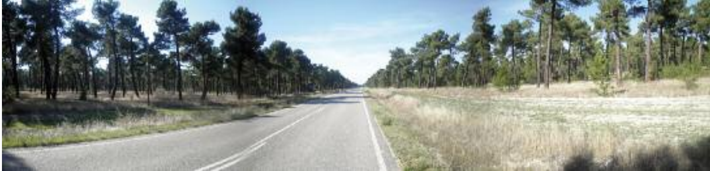
Tierra de Pinares