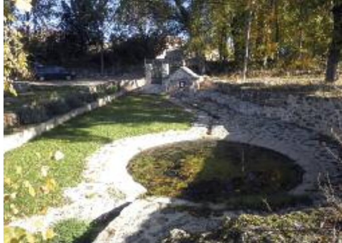
Fuente de Villafranca

Cerezo de Abajo es un pueblo marcado por el paso de la Nacional I y tiene una iglesia que fue trasladada desde Mansilla, en honor a