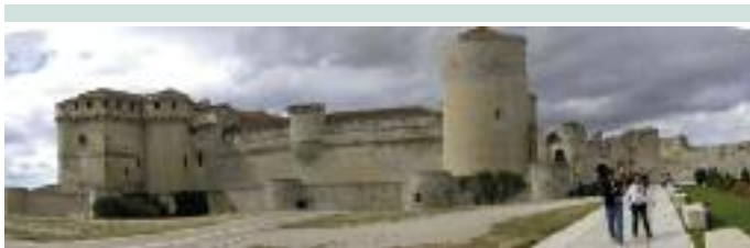
Castillo de Cuéllar

En Aldeonsancho , iglesia de San Lorenzo; conserva un reloj de sol.