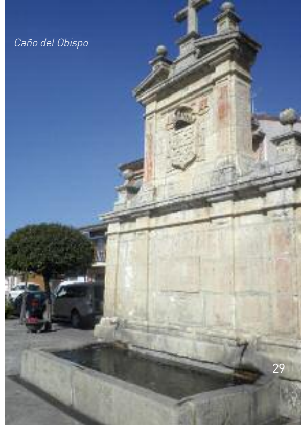
Caño del Obispo