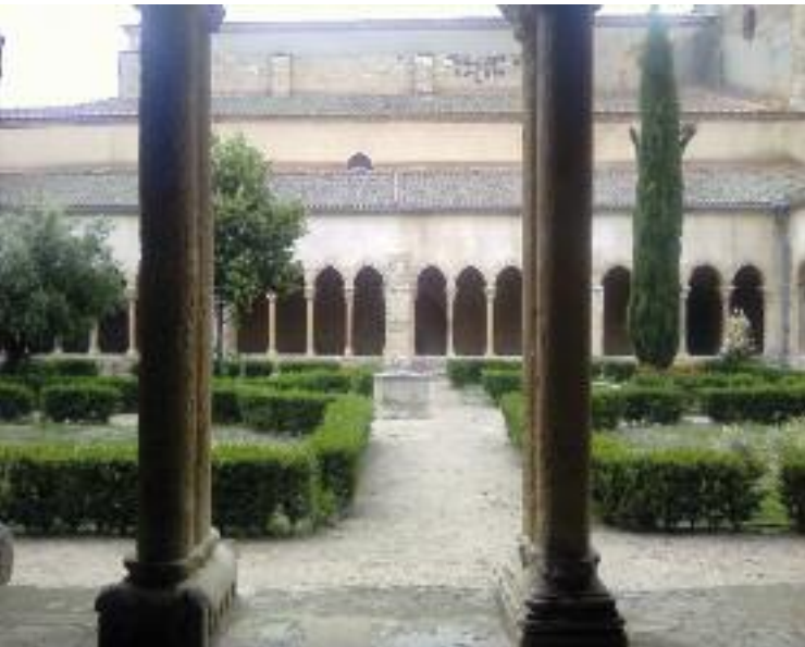
Claustro del Monasterio de Santo Domingo en Santa María La Real de Nieva

un bosque de encinas, cruza el terreno de pizarras en el denominado macizo satélite de Santa María y concluye en la tierra de pinares de Nava de la Asunción.