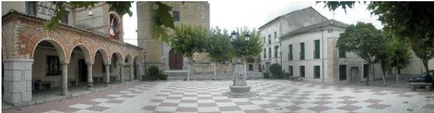
Plaza de Sangarcía

En Santa María la Real de Nieva , iglesia de Nuestra Señora de La Soterraña, plaza de toros y claustro del monasterio de Santo Domingo; en Nieva , iglesia de San Esteban y monasterio.