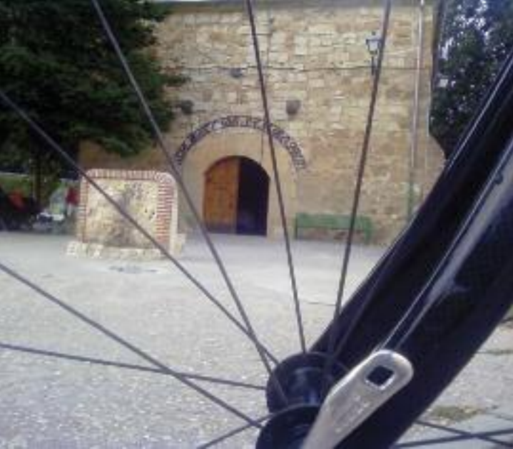
Ermita de la Virgen del Rosario en Mozoncillo