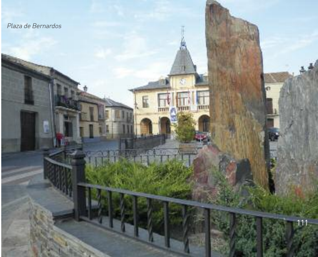
Plaza de Bernardos

1 Cruzamos la localidad de Carbonero por la calle de San Roque, desde la antigua carretera en la que desembocamos, primero a la derecha y después la primera a la izquierda; llegar a la calle Mozoncillo pasando por la plaza del Caño. El camino viejo de Mozoncillo pertenece a esas comunicaciones entre localidades que antes eran de arena pero que han sido asfaltadas recientemente.