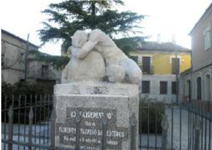
"Adán arrepenido" en Aguilafuente

En Aldeonte , iglesia de San Frutos Pajarero y en honor a su nombre, pues significa adea de agua, posee junto a la iglesia tres fuentes, en el camino a Boceguillas fuente de la Capalana; para salir de Aldeonte, giro a la izquierda, dirección Boceguillas.