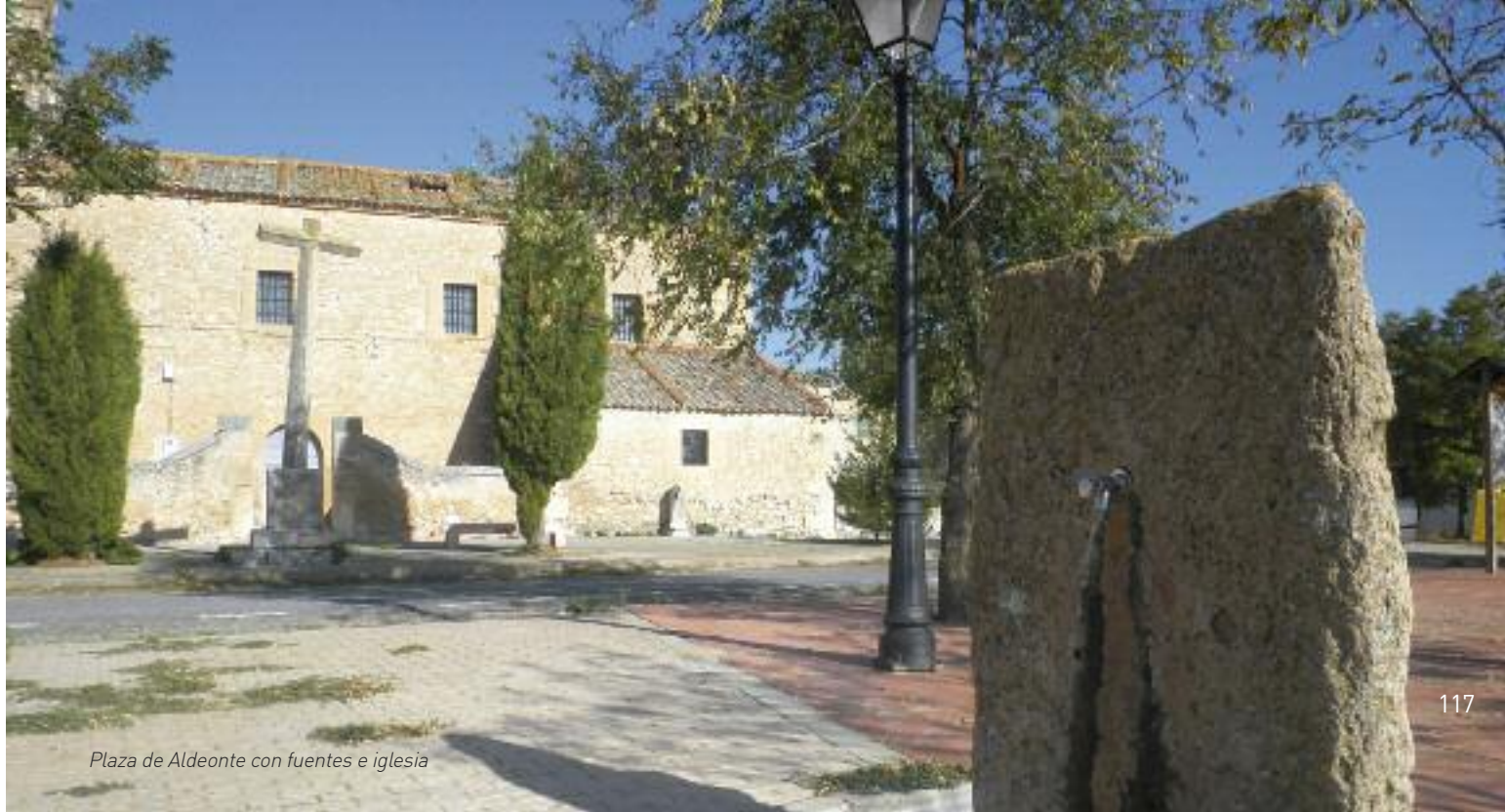
Plaza de Aldeonte con fuentes e iglesia