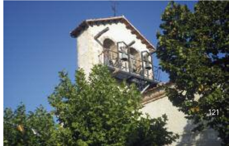
Campanario de la iglesia de Sebúlcór

En BOCEGUILLAS , casa blasonada del Cardenal Cisneros y templo en honor a Nuestra Señora del Rosario.