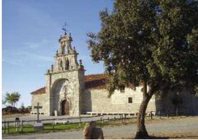
Ermita de San Antonio

Nuestro paisaje está dominado por la sierra del Guadarrama , y especialmente testigo en todo nuestro pe-