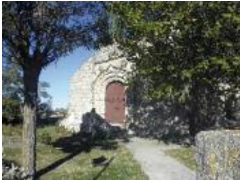
Iglesia de La Losa

Los dueños de los ganados solían vivir con su familia durante el tiempo que duraba el esquila, por lo que construían palacios rurales en los que colgaban sus blasones o escudos. Estaban todos situados cerca de la capital, ya que en ella se concentraban las industrias de la lana.