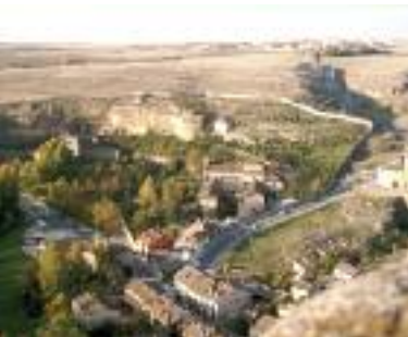
Barrio de San Marcos