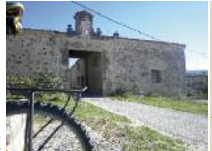
Rancho de esquila en Ortigosa del Monte