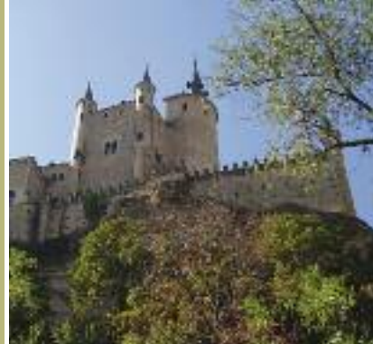
Alcázar de Segovia

El ejemplo más notorio lo encontramos a 11 kilómetros de la capital: el Palacio de Riofrío mandado construir por Isabel de Farnesio y que tuvo una desconcertante suerte; convertido hoy en museo de caza, es un rincón fascinante para el visitante y agradable para el pedalear. Atravesamos un bosque de encinas para encontramos el Palacio de Riofrío, y contemplar la reserva de gamos y corzos que posee.