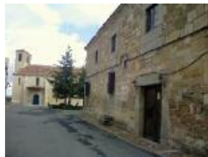
Iglesia Tomás de Canterbury y palacio de Giraldehi