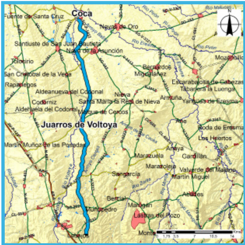
RUTA 4 CAÑADA REAL LEONESA Elevation (m)